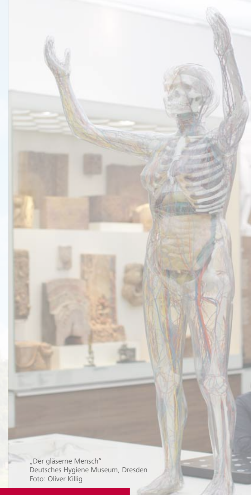
„Der gläserne Mensch“ Deutsches Hygiene Museum, Dresden